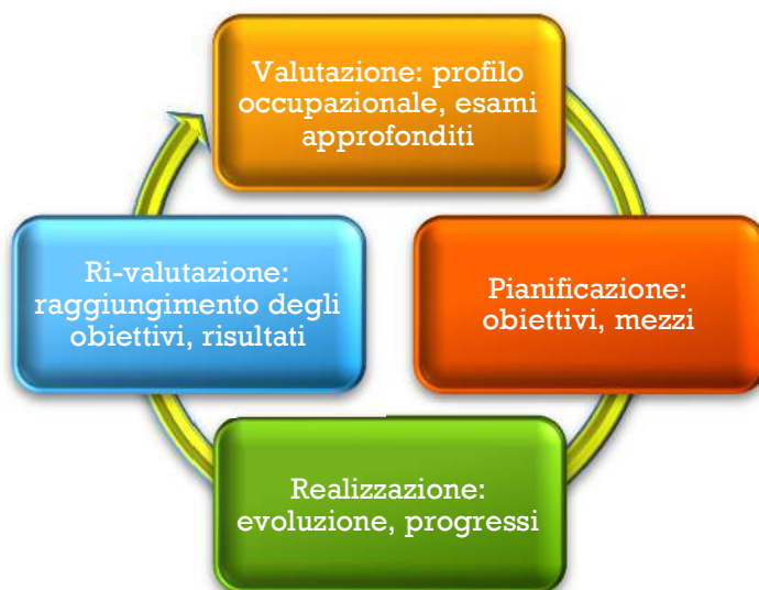
Figura 1. Le tappe del processo in ergoterapia

La maggior parte degli interventi in ergoterapia comprende diversi obiettivi che si organizzano nel tempo (Creek & Bullock, 2008 ; Pollock et al., 2010 ; Radomski, 2008). Così vengono elaborati degli obiettivi corrispondenti alle finalità attese alla fine del trattamento. Essi sono raggiunti progressivamente superando diversi scopi detti a breve termine e riguardano delle performance all'interno di alcune attività particolari per le quali il cliente avrà ottenuto un risultato che lo soddisfa entro la fine del trattamento. Anche Park (2009) prevede degli obiettivi a lungo termine che superano la fine dell'intervento pianificato e che corrispondono a delle aspirazioni occupazionali. Anche se queste aspirazioni occupazionali non sono raggiungibili in un futuro prossimo, esse danno un senso agli sforzi inerenti ad ogni raggiungimento d'obiettivo.